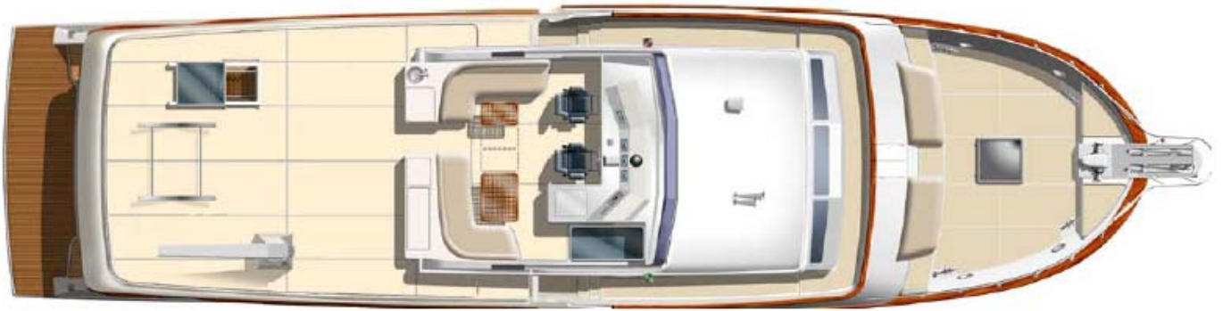
76 Aleutian RP \ Flybridge & Deck Layout