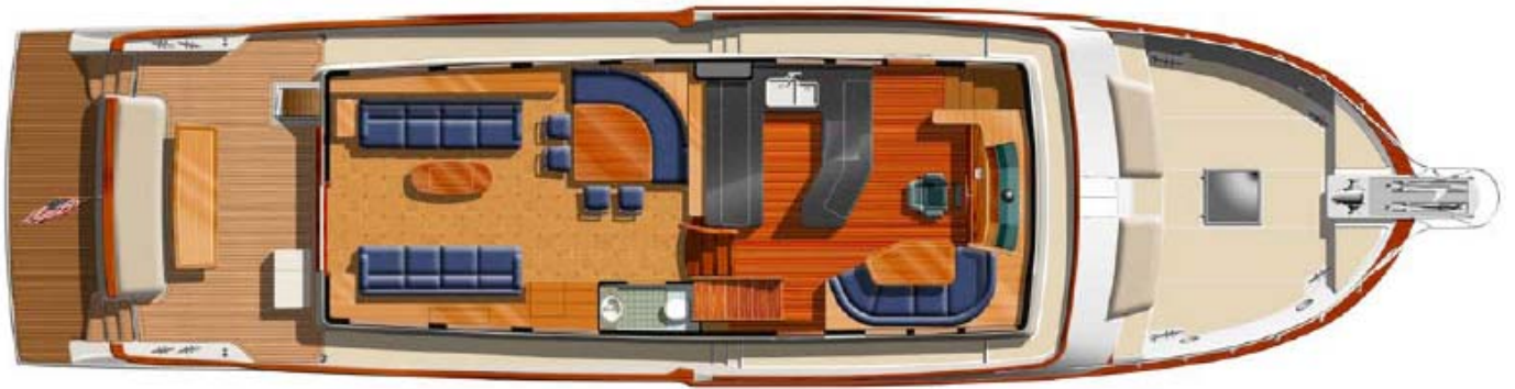
76 Aleutian RP \ Standard Main Deck Layout