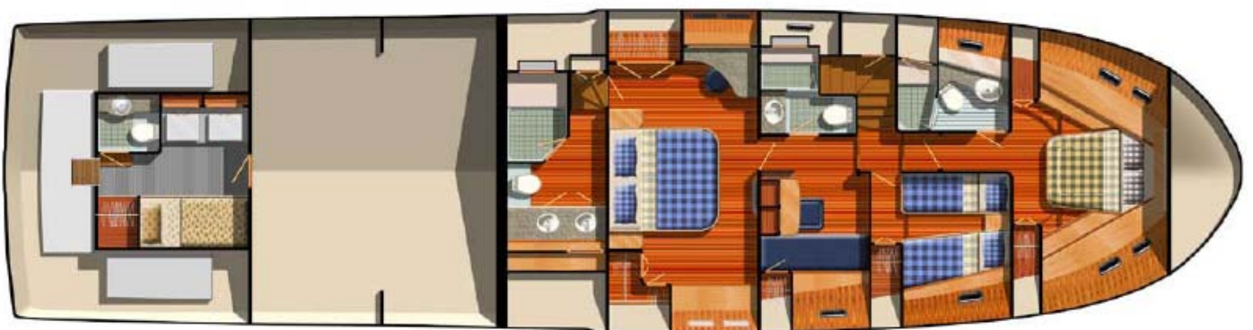
76 Aleutian RP \ Standard Lower Deck Layout